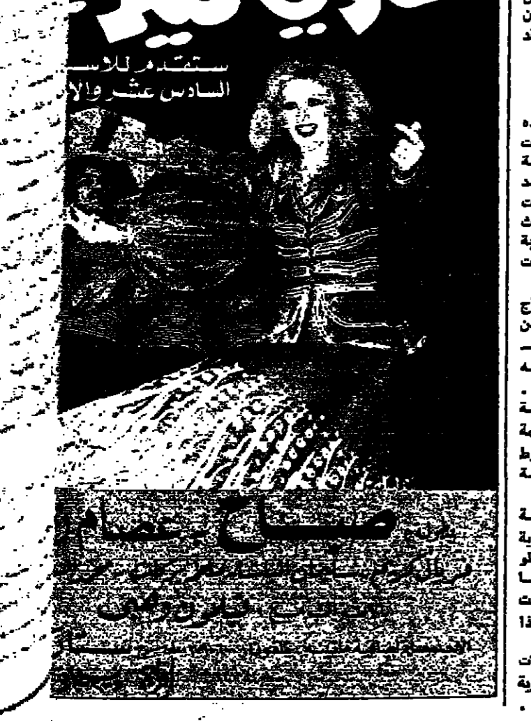
السادات تحت ورا